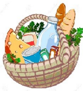
table du curé:

Nous vous attendons nombreux et venez partager vos talents avec nous. »