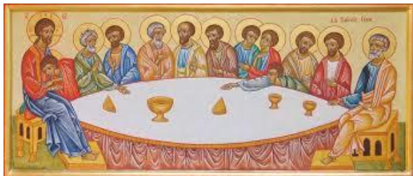
Table Ouverte œcuménique

Histoire de varier les formules, nous avons pensé cette année, plutôt qu'un gros événement début Avent, proposer plusieurs événements simples et conviviaux au cours de l'année. Pour amorcer, la Table Ouverte Paroissiale (TOP) du deuxième dimanche de Saint-Germain deviendrait une TOPO, avec tables mélangées permettant la rencontre, qui ne se prolongera